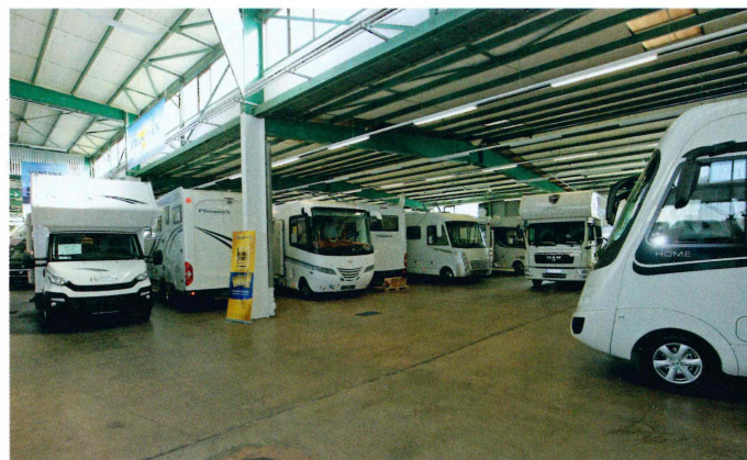
In einer großen Halle können Interessenten bei Schmidtmeier in Steinenbronn stets unter rund 200 Freizeitfahrzeugen auswählen.