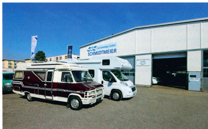
Schmidtmeier ist in Steinenbronn bei Stuttgart auf das Areal einer ehemaligen Spedition umgezogen.